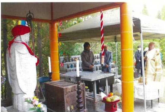
水子地蔵尊合同供養祭