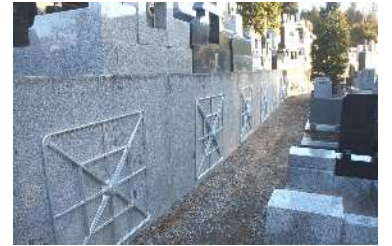
西3区・西5区擁壁工事