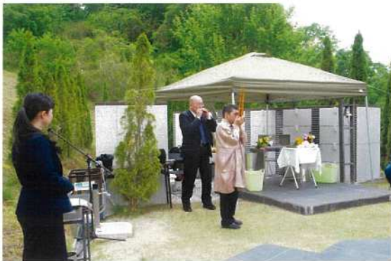
やすらぎの碑慰霊祭