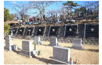
西10区大型擁壁工事