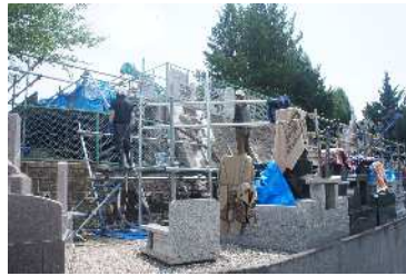
西2区高所擁壁工事