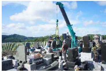
罹災墓石取外し工事