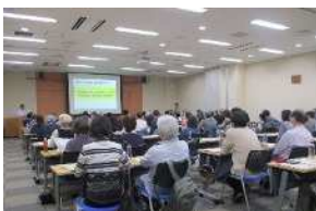
終活セミナーの様子